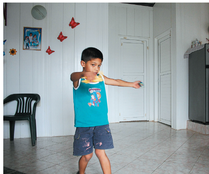
Las petrocasas tienen dos baños, tres habitaciones, sala-comedor y cocina